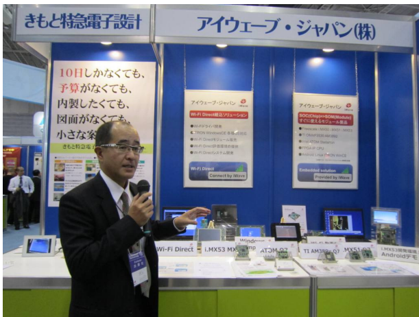
アイウェーブ・ジャパン ブースでの社長説明