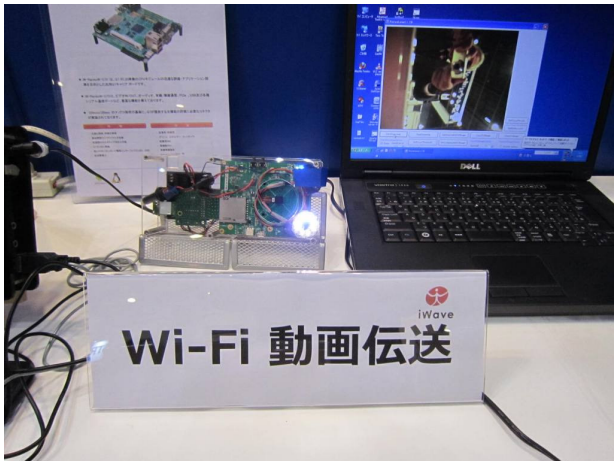
Wi-Fi 動画伝送 (iWave 製) のデモ