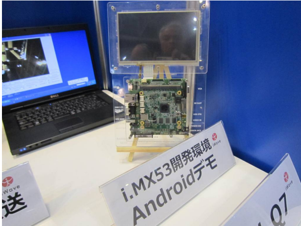
i.MX53 開発環境 Android (iWave 製) のデモ