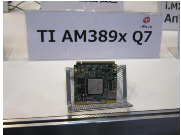
TI AM389x Q7 (iWave 製) の展示