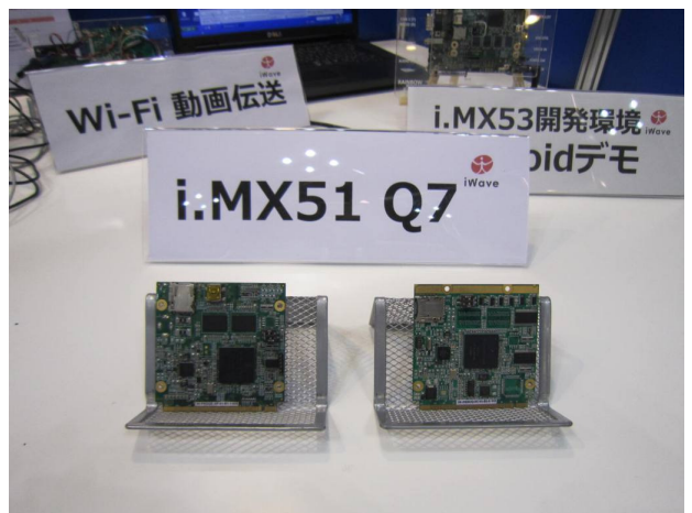
i.MX51 Q7 (iWave 製) の展示