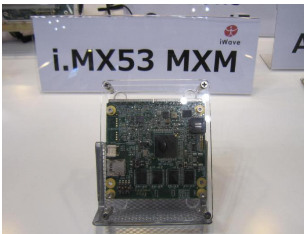
i.MX53 MXM (iWave 製) の展示