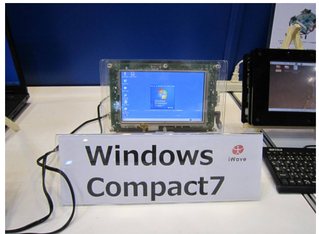
Windows Compact7 (iWave 製) のデモ