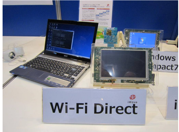
Wi-Fi Direct (iWave 製) のデモ