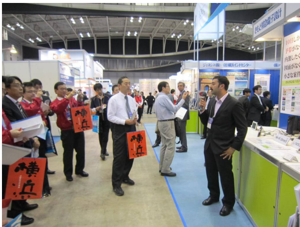
アイウェーブ・ジャパン ブースでお客様にご説明