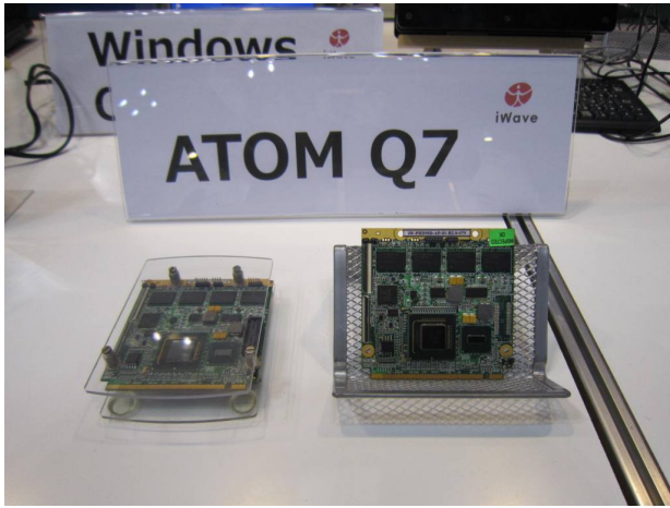
ATOM Q7 (iWave 製) の展示